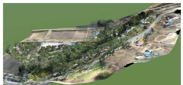
図-2 3次元地形モデル